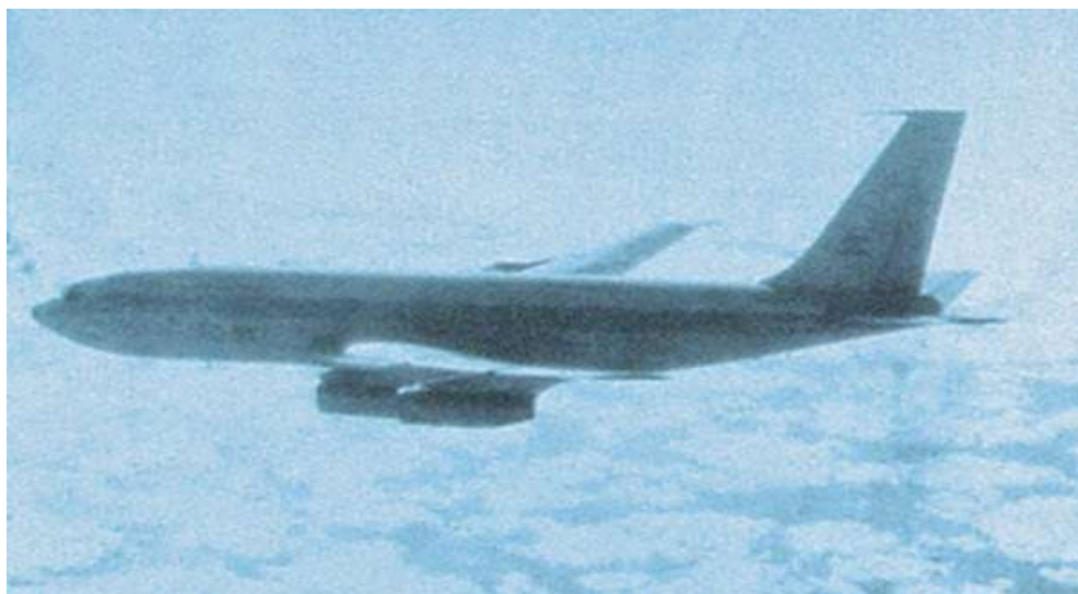
TC-91 fotografiado desde el Sea Harrier XZ460

El piloto del Sea Harrier parecía interesado en el Boeing, aparentaba buscar la antena del “sofisticado” radar que dio con la posición de la flota.